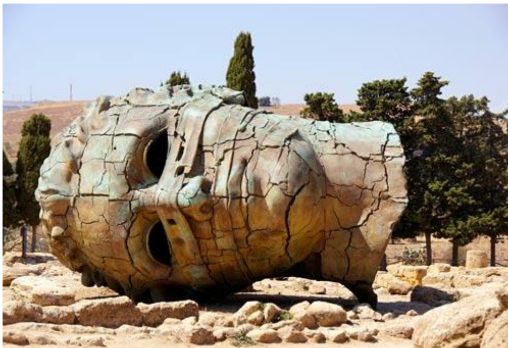
Храм Зевса, Археологический Парк ла Валле деи Темпли, Г.Агридженто, Сицилия