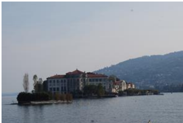
Foto 16. Остров Белла