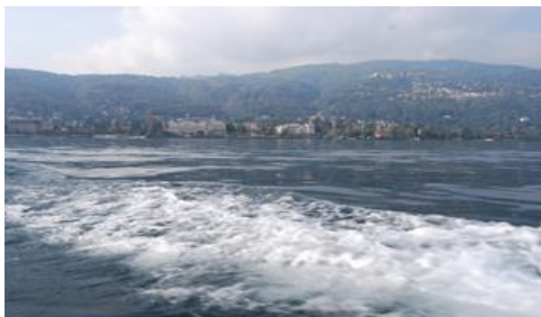
Foto 18. Вид на Стрезу с озера Маджиоре

Стреза это маленький городок с 5000 жителями на озере Маджиоре, известный уже с 998 г. Начиная с 1961 года, город знаменит проводящимися Международными Музыкальными Неделями на озере Маджоре. В 1935 году в Стрезе было заключено соглашение между Италией, Францией и Англией, так называемый Фронт Стрезы. В 2004 г. город принимал 52 ю конференцию Группы Билдерберг. Роскошные отели расположены вдоль озера – Реджина Палас, Гранд Отель дез Иль Борроме ... Я уже была здесь в 17 лет, читая Хэмингуэя...