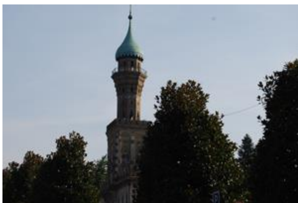
Foto 19. Вилла Креспи