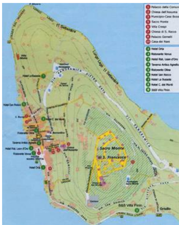
Фото 23. Полуостров Орта

Заповедник Священная Гора Орта в 2003 году был внесен в список Мировых Достояний Человечества, охраняемых под эгидой ЮНЕСКО (World Heritage List) , поскольку "представляет собой интеграцию между архитектурой и декоративным искусством пейзажа исключительной красоты и имеет высокое духовное значение, достигнутое в критический период истории Римской Католической Церкви" .