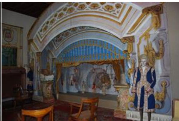
Foto 4. Театр марионеток