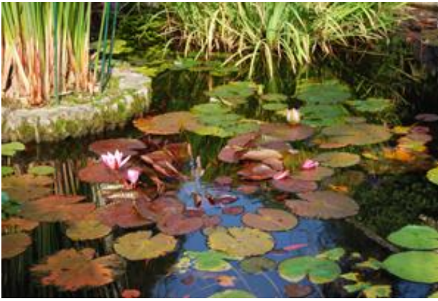
Foto 11. Часть прудика