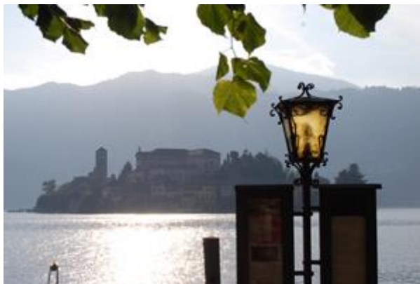
Foto 20. Остров Святого Юлия

Со стороны романтического поселка Орта Святого Юлия, расположенного на озере Орта, открывается великолепный вид на остров Святого Юлия, на котором находится Собор Святого Юлия IV века, основанный Святым Юлием, перестроенный в IX и XI веках. В здании 800 х годов сегодня проживают монахини затворницы бенедиктинки, единственные люди, проживающие на озере. В 1973 году на острове был основан монастырь бенедиктинцев, Маттер Экклезиэ, в котором выполняются важные исследования, изучение и переводы античных текстов. Монастырь владеет также лабораторией реставрации и исследовательским центром по изучению античных рисунков. Археологические исследования продемонстрировали присутствие человека на озере с античных времен, с неолитического периода железной эры. Возможно также, что остров являлся культурным предхристианским центром. Остров Святого Юлия, единственный остров на озере Орта, размерами 275 х 140 метров, расположен на расстоянии около 400 метров от берегов и берет свое имя от Святого Юлия, который прибыл в эти края в 390 году вместе с братом Святым Юлианом. Родом с греческого острова Ежина, братья были организаторами Христианства на территории Новарры и вокруг озера. Они посвятили свою деятельность, с одобрения императора Теодосия I, разрушению культовых мест язычников и строительству церквей. Братьям приписывают строительство 100 церквей и часовен. Святой Юлиан является покровителем каменщиков.