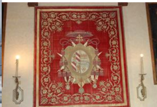
Foto 2. Гобелен