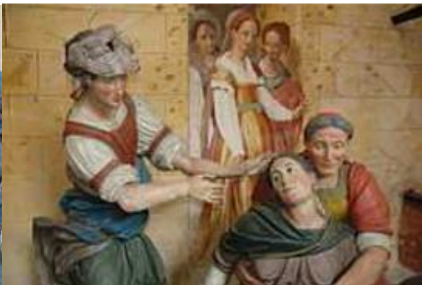
Foto 25. Кристофоро Престинари, Часовня I, Рождение Св.Франциска, ок.1605 г.

Епископ Новары Карло Баскапé, верный исполнитель магистрата римского кардинала Св.Карло Борromeо, между 1593 и 1615 годами дал значительный толчок работам на Священной Горе, лично наблюдая за декорацией часовен. Над реализацией фигур и картин работали такие известные мастера как скульпторы Джиованни ди Энрико и Кристофоро Престинари, художники Джиованни Баттиста и Джиованни Мауро делла Ровере, называемые Фиамменгини, художники Пьер Франческо Маццукелли, прозванный Мораццоне и Антонио Мария Креспи, прозванный "Бустино", скульптор Дионис Буссола, миланские братья Карло Франческо и Джузепе Нуволоне,