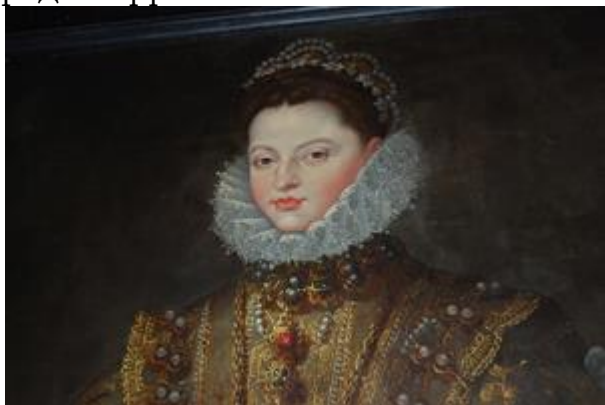
Foto 3. Портрет Дамы