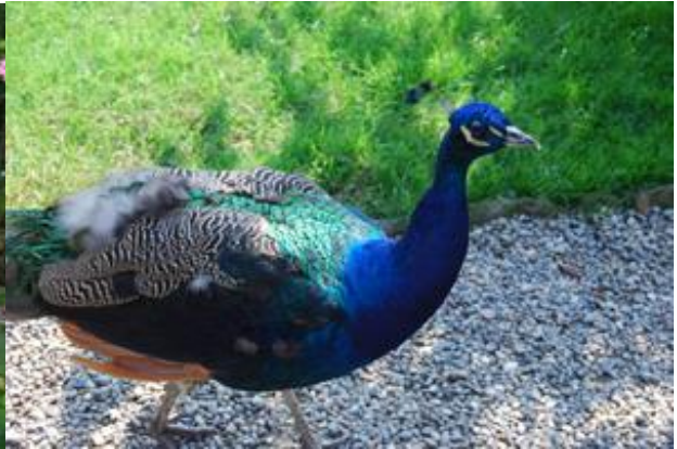
Foto 14. Павлин

Аллеи Сада имеют свои имена: Аллея Африки, Аллея Камелий, лужок Гобби (где находятся редкие экземпляры Taxodium Distichum ), лужок Generyum , Площадь Попугаев, галерея Кашмир, площадь Часовен, Аллея Пальм. В саду имеются редчайшие экземпляры, как 200 летний Кашмирский кипарис и 125 - летняя пальма Jubaeae Spectabilis . В Саду, который французский писатель Гюстав Флобер назвал «земным раем», свободно расхаживают разноцветные павлины, попугаи и фазаны». (1)