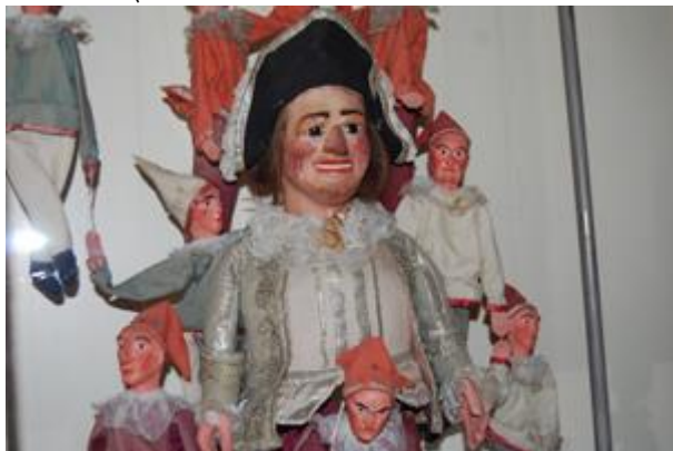
Foto 5. Персонажи

Зал Кукол хранит важную коллекцию французских и немецких кукол 800 х годов. Коллекциям марионеток и камерных театров XVII, XVIII и XIX веков посвящены 3 зала.