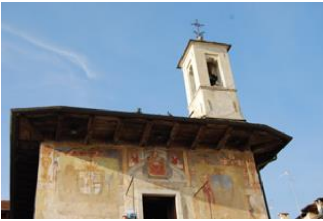
Foto 21. Дворец Сообщества Ривьеры