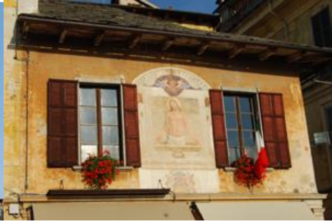
Foto 22. Орта Святого Юлия

Он считается символом феодального государства Ривьеры Святого Юлия, основанной в XII веке: здесь применялись как законодательство, так и исполнительная власть. Внешние стены Дворца декорированы гербами некоторых епископов Новарры; на фасаде изображен герб городка Орта и написано "Hortus Conclusus", что означает «секретный сад, который предоставляет укрытие и охраняет от зла». Внешняя лестница ведет на 1 й этаж, состоящий из большого зала с окнами, обращенными на площадь. В зале расположена фреска периода барокко, которая представляет Мадонну и Святых Франциска и Юлия: святому Франциску посвящена Священная Гора, а Святой Юлий является наиболее почитаемым святым в зоне Кузио. На западном и основном фасаде расположены солнечные часы, которые служили для обозначения времени посредством движения тени. Три квадранта были повреждены временем и сейчас невозможно определить время, но все еще возможно видеть символы месяцев, декорации и часовые линии. (11)