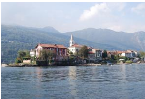
Фото 17. Остров Рыбаков

Размеры Острова Суперьоре или Острова Рыбаков - 100x 350 м (3,5 га), он является наиболее маленьким среди островов Борромео. Единственный среди островов Борромео, на котором проживают круглый год 50 жителей в маленькой деревушке с характерной площадью, закрытой узкими улочками, ведущими прогуляться к острому окончанию острова. Характерны многоэтажные домики, возведенные для экономии пространства: они почти все оснащены длинными балконами, необходимыми для сушки рыбы. Рыбная ловля все еще практикуется и можно насладиться свежими морепродуктами в многочисленных трактирах с видом на озеро.