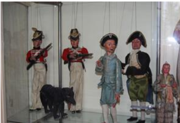
Foto 6. Персонажи