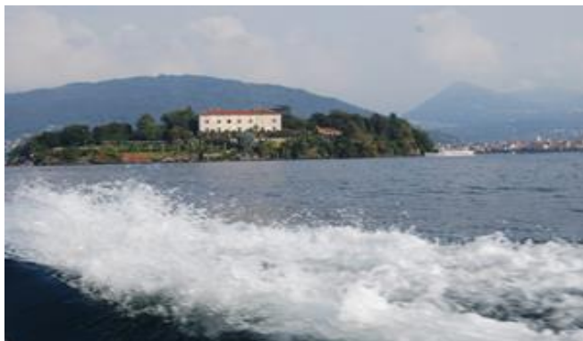
Foto 1. Остров Матери