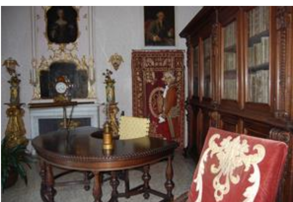
Foto 8. Библиотека

В начале 800 х годов семья Борромео создала Ботанический Сад в английском стиле, где благодаря мягкому климату уживаются клены, бананы, камелии, эвкалипты, пальмы. Перед входом во Дворец располагаются 2 прудика с различными водными орнаментальными растениями, среди которых Nimphaea фиолетовых и розовых тонов.