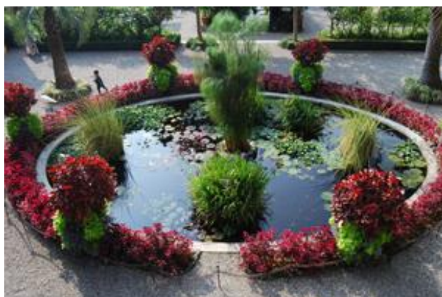
Foto 9. Прудик

В начале 800 х годов семья Борромео создала Ботанический Сад в английском стиле, где благодаря мягкому климату уживаются клены, бананы, камелии, эвкалипты, пальмы. Перед входом во Дворец располагаются 2 прудика с различными водными орнаментальными растениями, среди которых Nimphaea фиолетовых и розовых тонов.