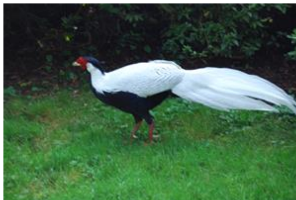
Foto 15. Фазан

Аллеи Сада имеют свои имена: Аллея Африки, Аллея Камелий, лужок Гобби (где находятся редкие экземпляры Taxodium Distichum ), лужок Generyum , Площадь Попугаев, галерея Кашмир, площадь Часовен, Аллея Пальм. В саду имеются редчайшие экземпляры, как 200 летний Кашмирский кипарис и 125 - летняя пальма Jubaeae Spectabilis . В Саду, который французский писатель Гюстав Флобер назвал «земным раем», свободно расхаживают разноцветные павлины, попугаи и фазаны». (1)