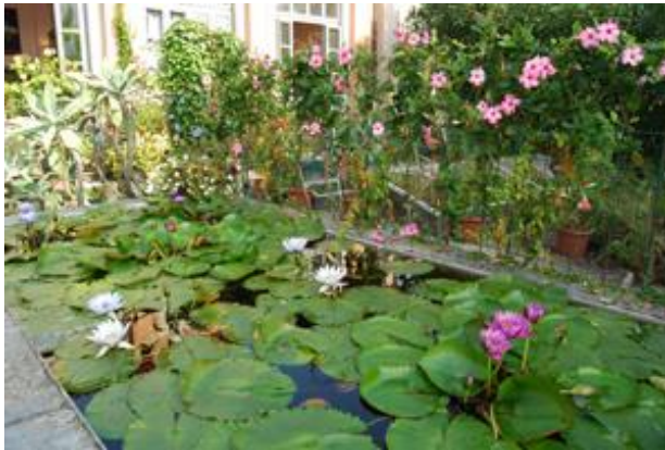
Foto 13. Часть прудика