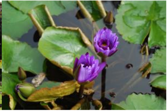
Foto 12. Nymphaea sp.